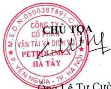
Ông Lê Tự Cường